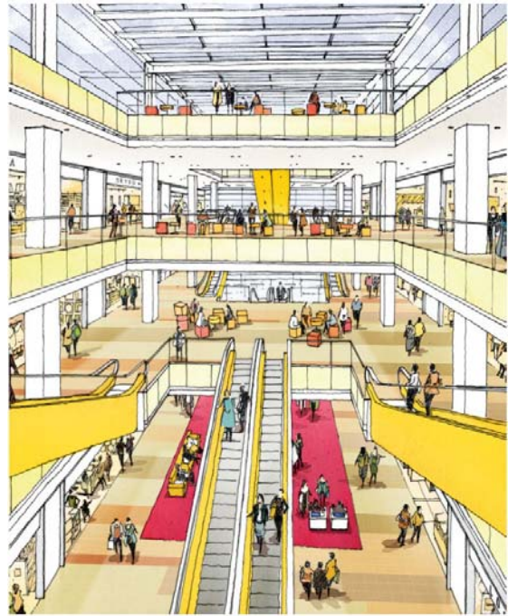
3階フードコートよりカスケードラウンジを望む