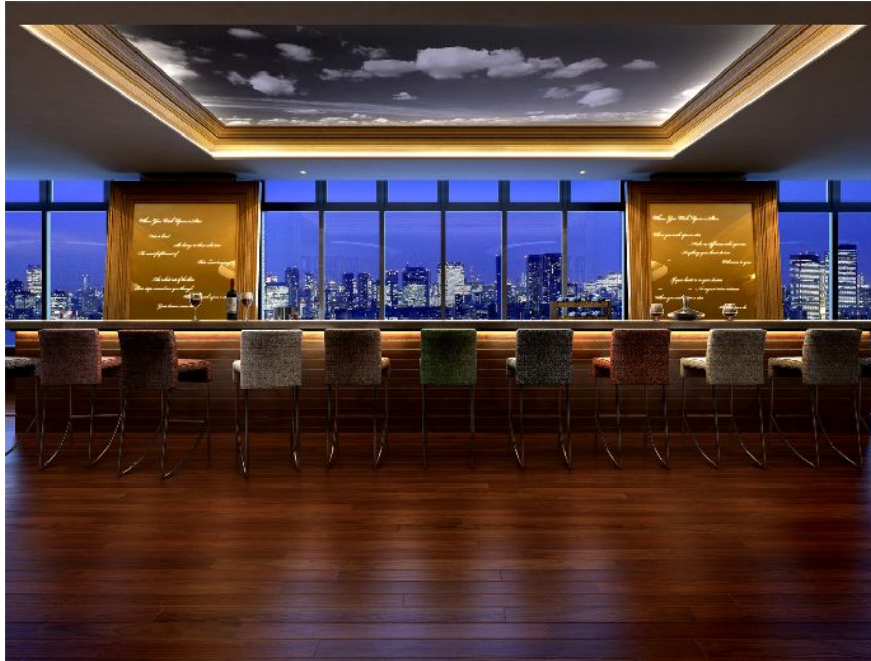
海越しに都心の摩天楼を望む33階のバーラウンジ。60席以上のキャパシティを誇り、居住者が昼夜を問わず眺望を楽しみながら寛げる空間