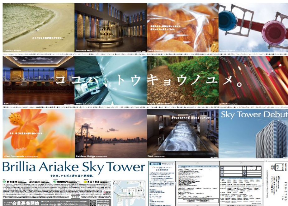
《ブリリア有明スカイタワー広告②》