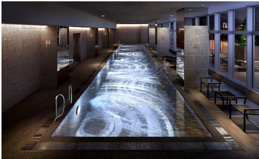
2階テラスが併設されるプール。夏場にはテラスともオープンに使用できるデザイン性あふれるリゾート仕様