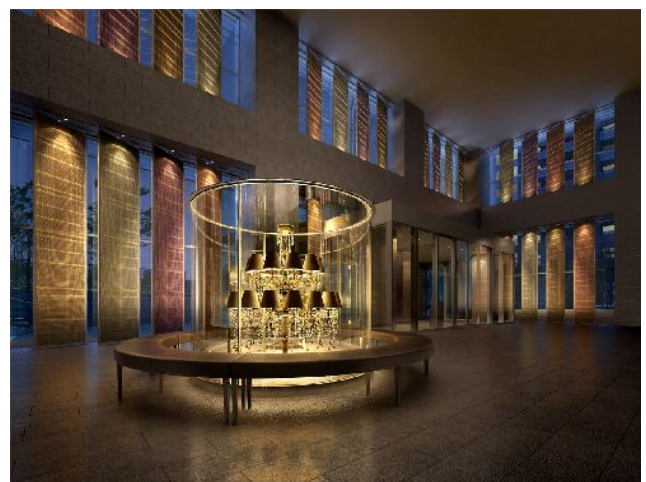
メッシュパネルとシャンデリアが荘厳さと煌きを空間に与える エントランス