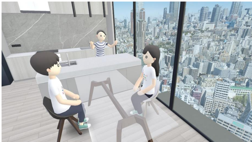
Tokyo Meta Living イメージ