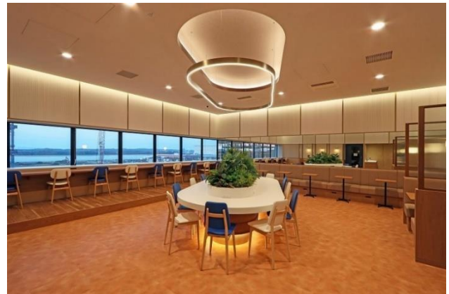
「T-LOGI 福岡アイランドシティ」ラウンジ